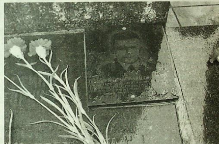
Среди имен на памятнике - имя нашего земляка Василия Шамшурина.