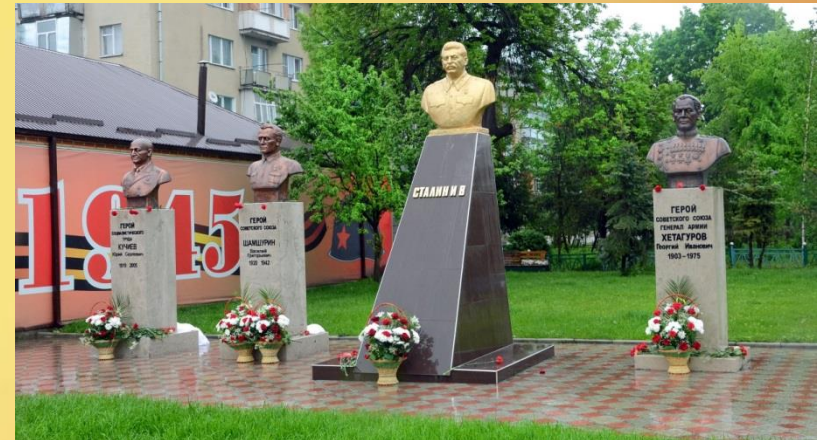
Делегация Киясовского района у бюста Героя Советского Союза В.Г. Шамшурина. г. Алагир 2014 г.