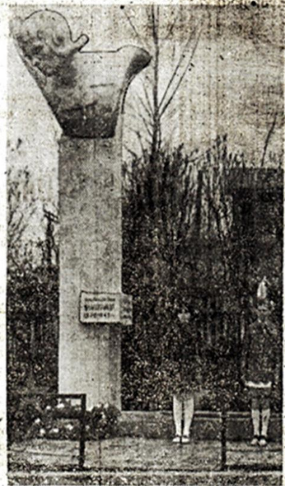
Пускай ты умер! Но в песне смелых и сильных духом всегда ты будешь живым примером.