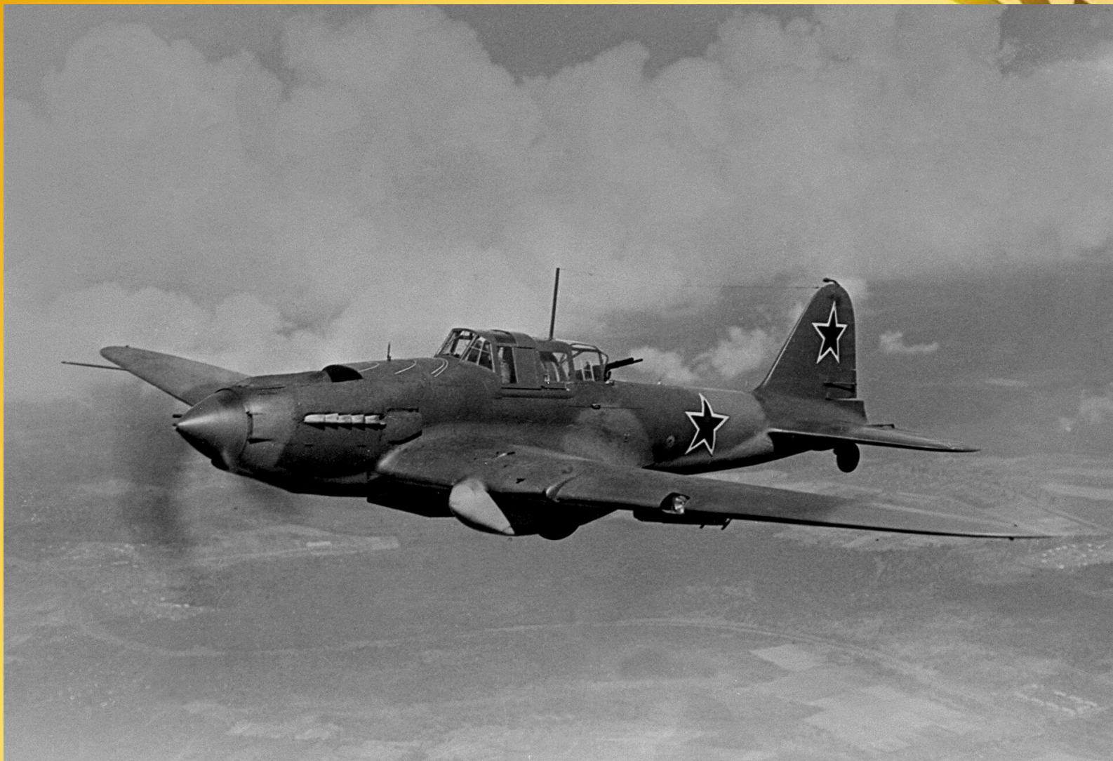
Самолет ИЛ-2. На таком самолете воевал В.Г. Шамиурин