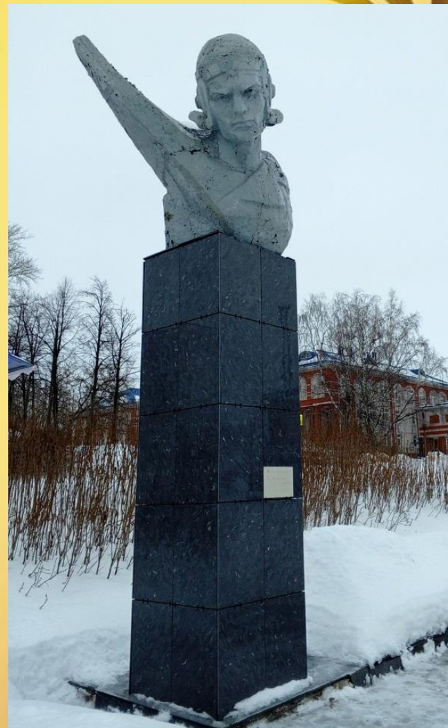
Памятник В.Г. Шамшуруну «Ты вечно будешь живым примером». Скульптор В. Табах. Установлен в 1969 г. с. Киясово