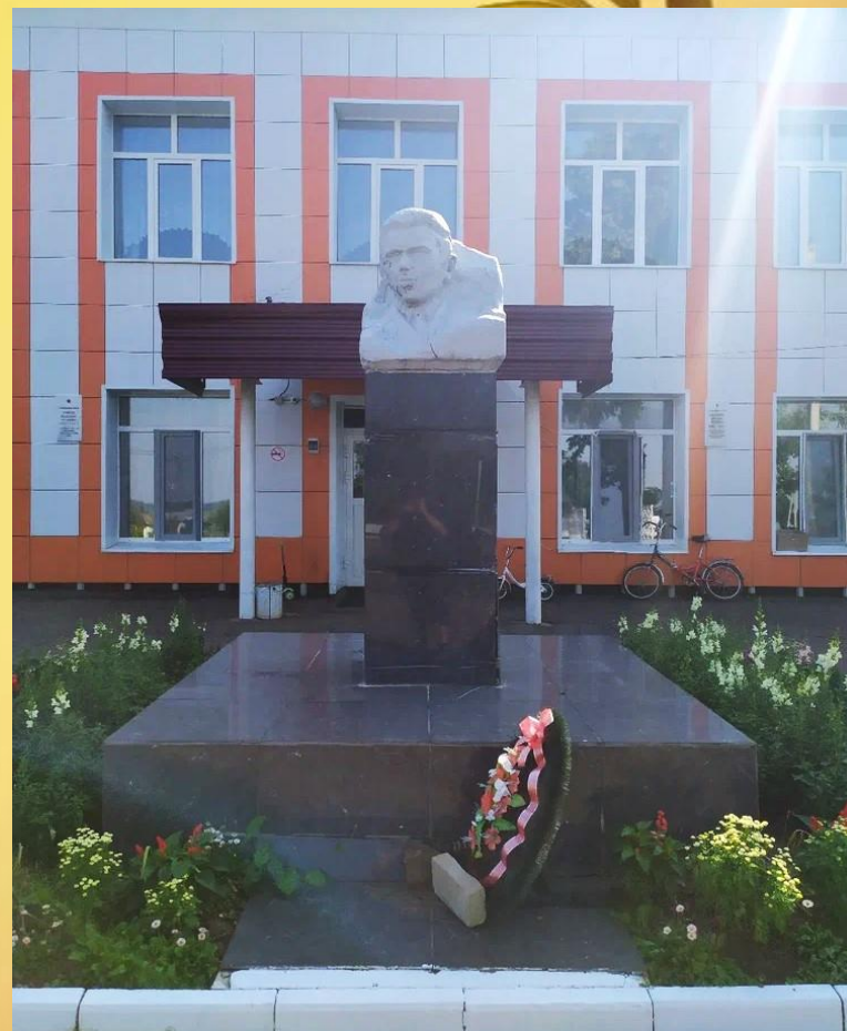
Бюст В.Г. Шамшурина. Скульптор М.Ф. Коробейников. Установлен в 1971 г. с. Киясово.