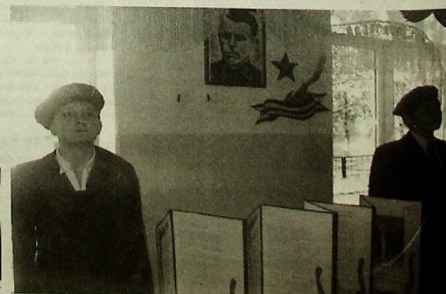
Вахта памяти в музее школы с. Дзуарикау.

Тема уроков мужества в школе с.Дзуарикау "Подвиг летчика В.Г.Шамшурина".