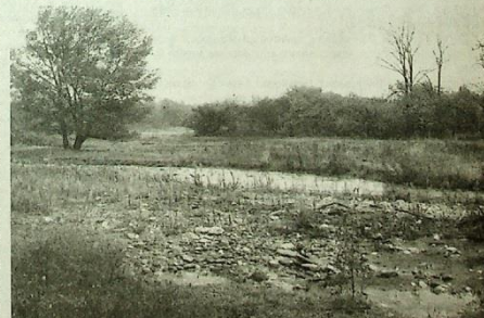
Место гибели Василия Шамшурина у с.Дзуарикау.