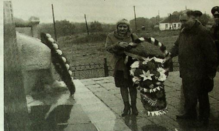
Возложение венка к памятнику погибшим в Великой Отечественной войне (с.Дзуарикау).

Не позабыть нам тех ребят, Не воскресить их чудесами, Живою памятью стоят Они у нас перед глазами. Пушки сейчас их с нами нет, Но весь народ гордится ими. Они погибли в 20 лет, Навек оставшись молодыми.