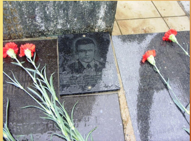
Памятник погибшим в годы Великой Отечественной войны. с. Дзуарикау. Фото 2011 г.