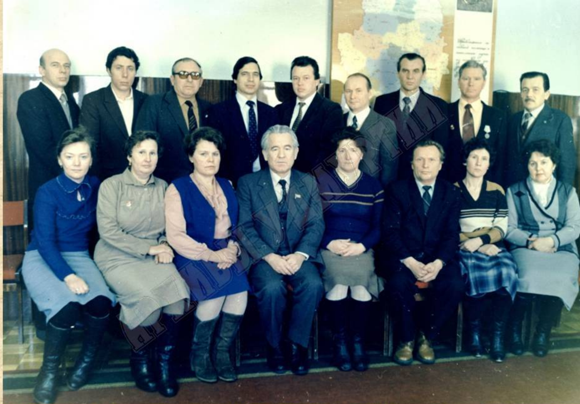
Министр здравоохранения УАССР В.Н. Савельев (в центре) среди членов республиканского профсоюзного актива работников медицинских учреждений. 1977 г. ЦДНИ УР. Ф. 5034. Оп. 1. Д. 206.