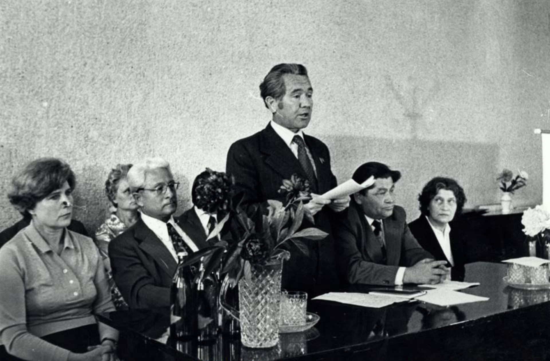
Министр здравоохранения УАССР В. Н. Савельев открывает Российскую научно-практическую конференцию в г. Ижевске по проблемам ортопедии и травматологии.. 1985 г. ЦДНИ УР. Ф. 5034. Оп. 1. Д. 243.