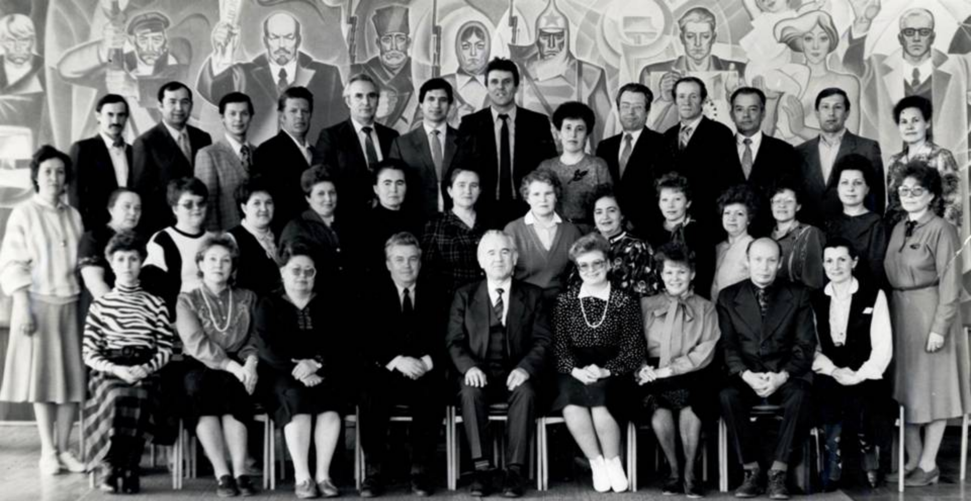
Секретари партийных организаций лечебных учреждений апрель 1990 г. г. Ижевск

Секретари партийных организаций лечебных учреждений. Министр здравоохранения УАССР В. Н. Савельев - в первом ряду сидит пятый слева. Ижевск, 1990 г. ЦДНИ УР. Ф. 5034. Оп. 1. Д. 262.