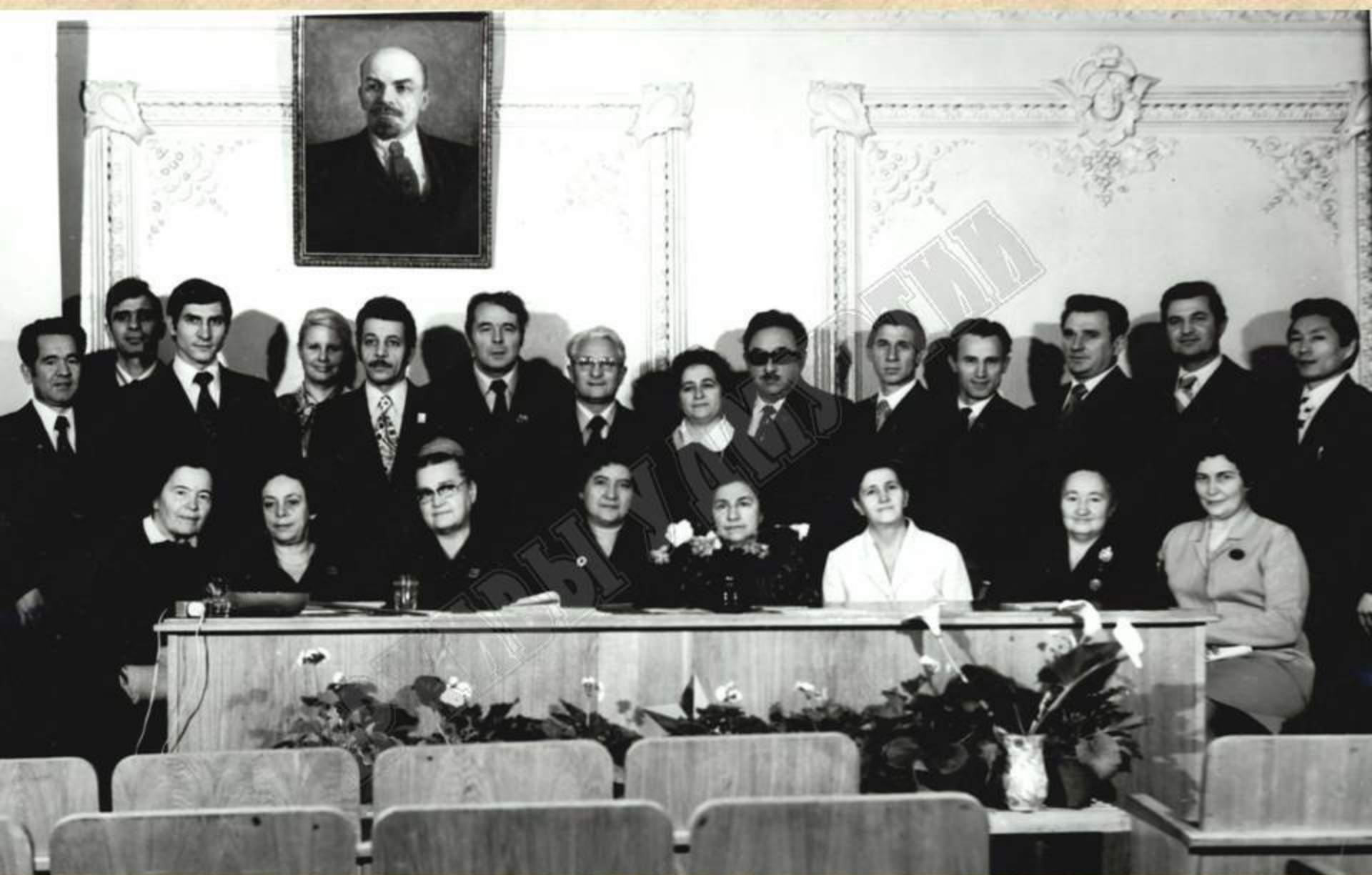
Министр здравоохранения УАССР В.Н. Савельев (1-й слева стоит) с участниками научной конференции, посвященной 30-летию Казанского НИИТО. 1975 г. ЦДНИ УР. Ф. 5034. Оп. 1. Д. 199.