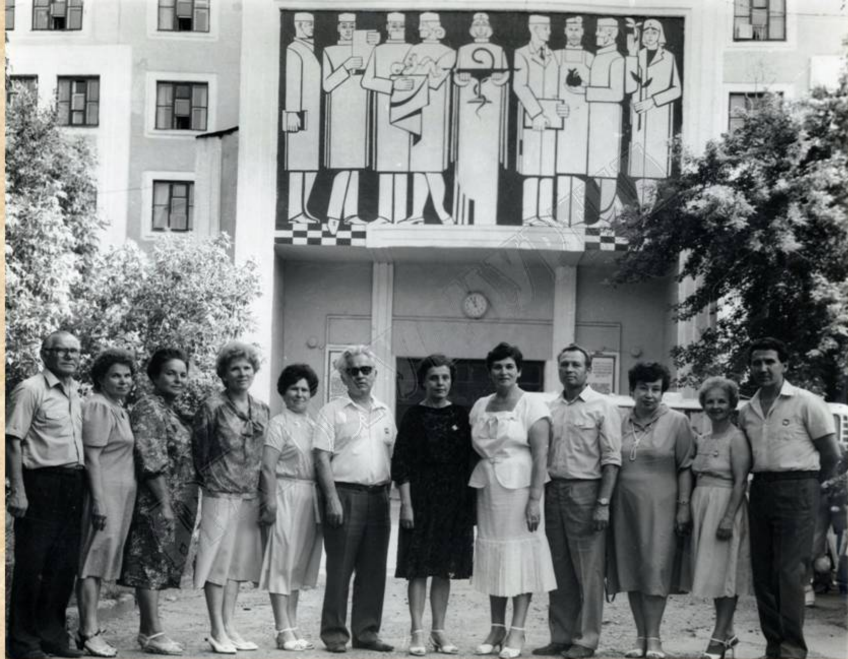
Министр здравоохранения УАССР В.Н. Савельев (в центре) среди участников встречи выпускников ИГМИ 1963 года. 1983 г. ЦДНИ УР. Ф. 5034. Оп. 1. Д. 240.