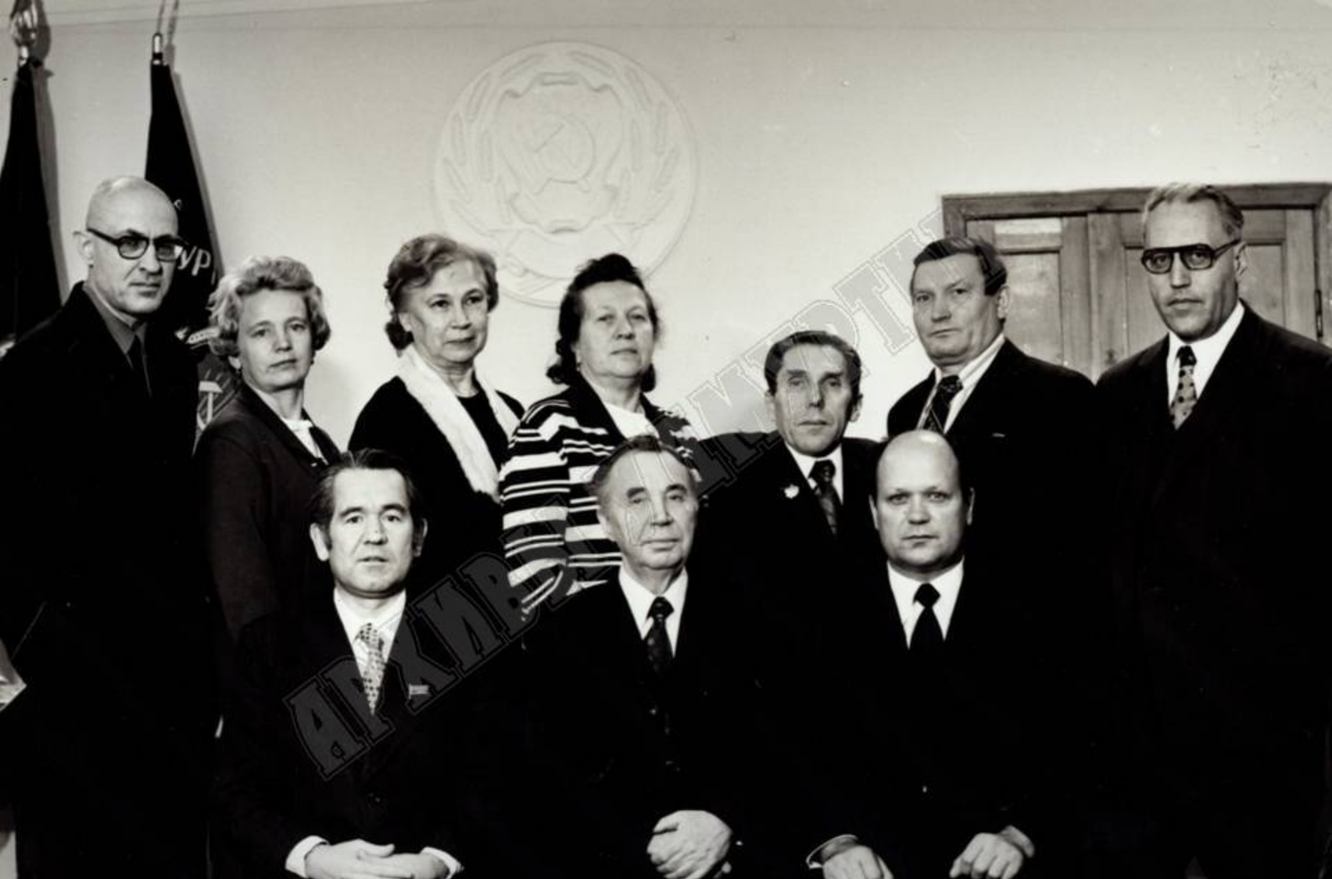
Министр здравоохранения УАССР В.Н. Савельев (слева сидит) с медиками, получившими правительственные награды УАССР.

1979 г. ЦДНИ УР. Ф. 5034. Оп. 1. Д. 218.