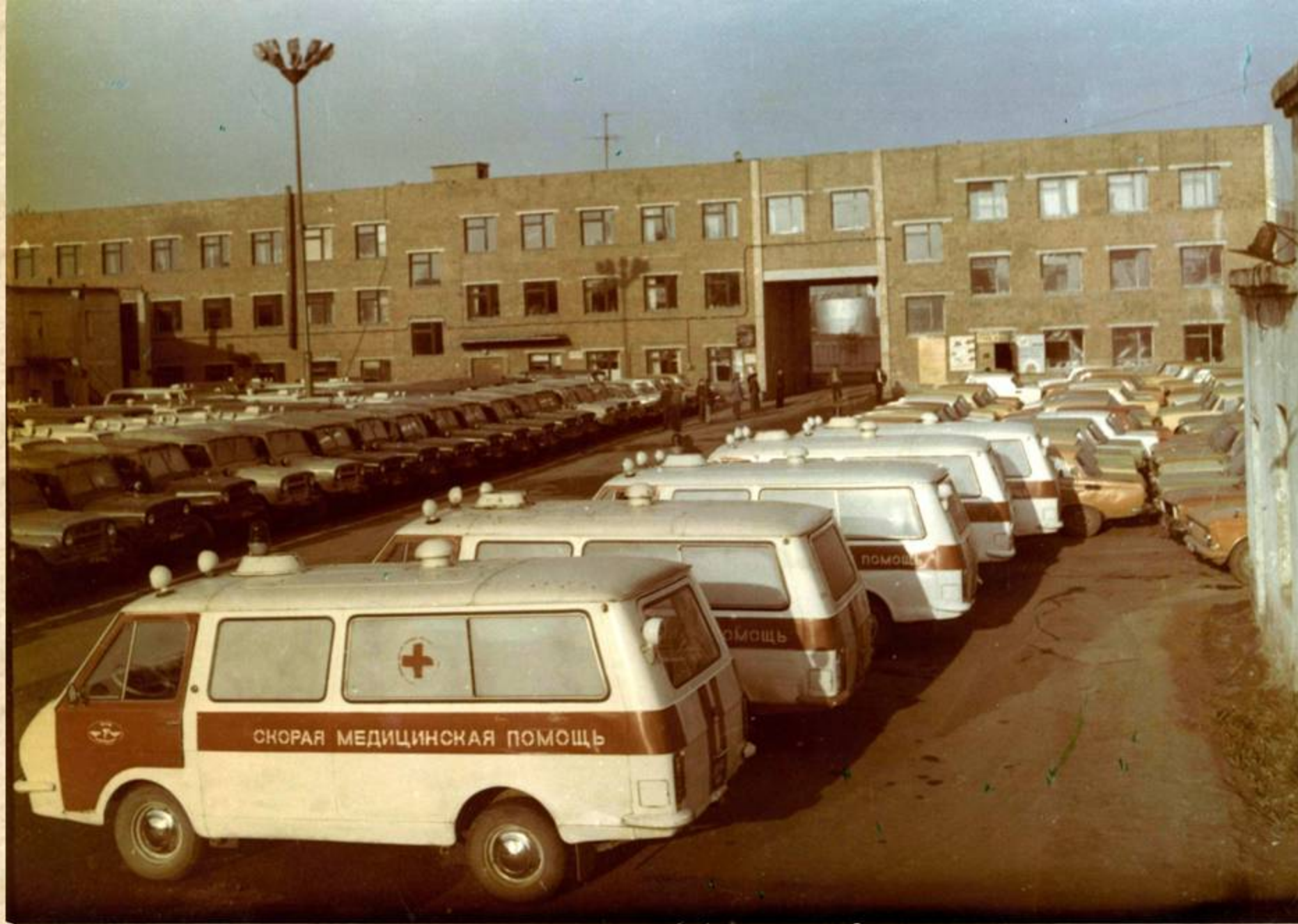
Автобаза Министерства здравоохранения. 1978-1980 гг.