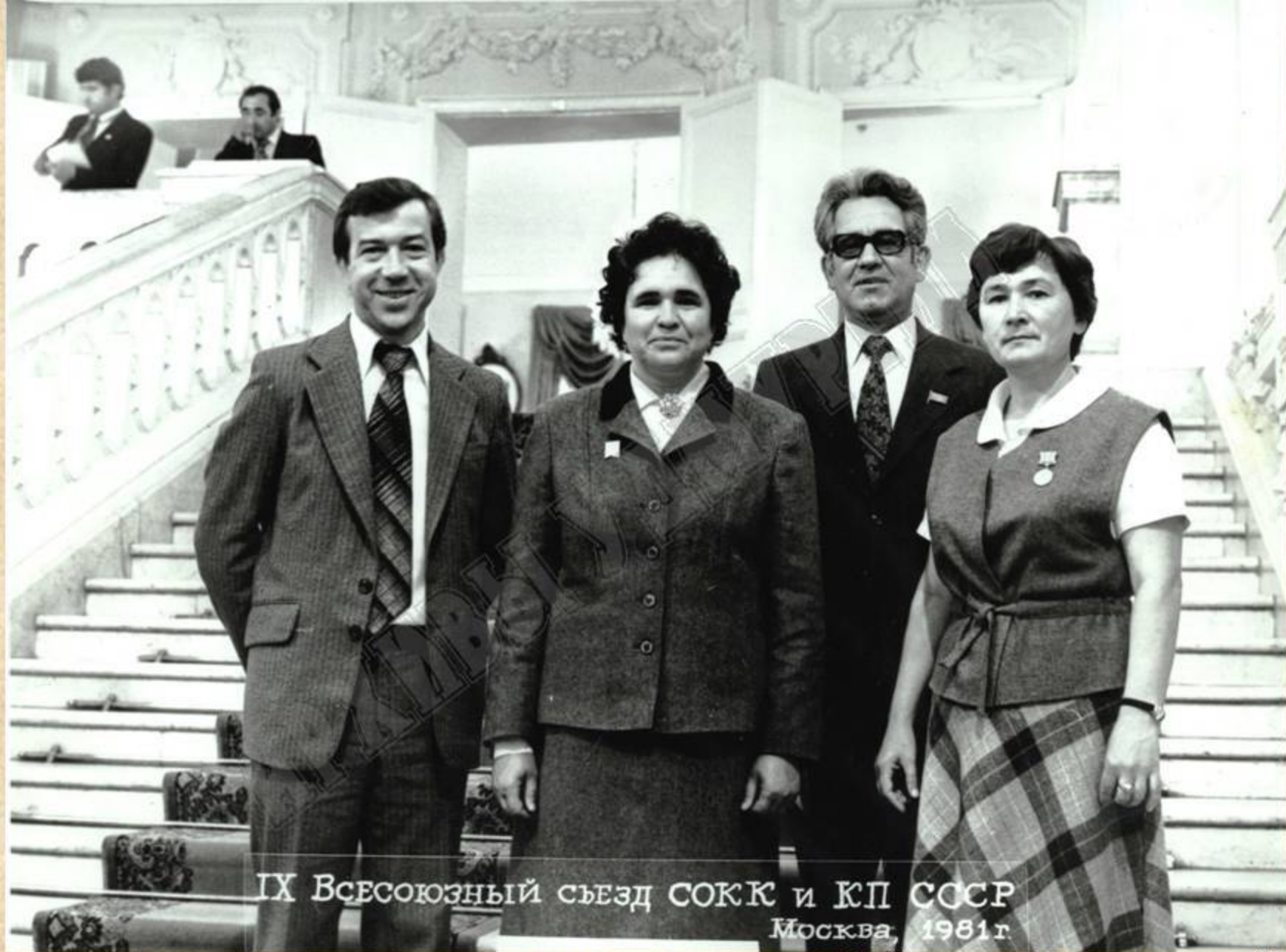
Министр здравоохранения УАССР В.Н. Савельев (2-й справа) с делегацией УАССР на IX Всесоюзном съезде Союза обществ Красного Креста и Красного Полумесяца СССР. Москва, 1981 г.