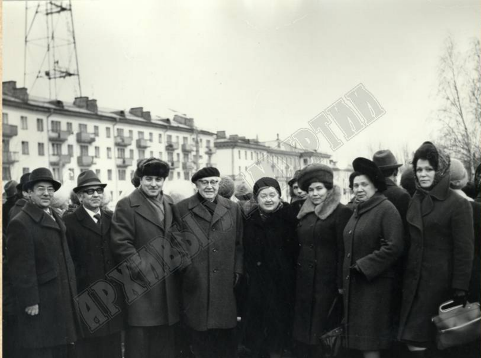
Министр здравоохранения УАССР В.Н. Савельев (2-й слева) с руководящими работниками Совета Министров УАССР на занятиях по гражданской обороне на Центральной площади г. Ижевска. 1979 г. ЦДНИ УР. Ф. 5034. Оп. 1. Д. 219.