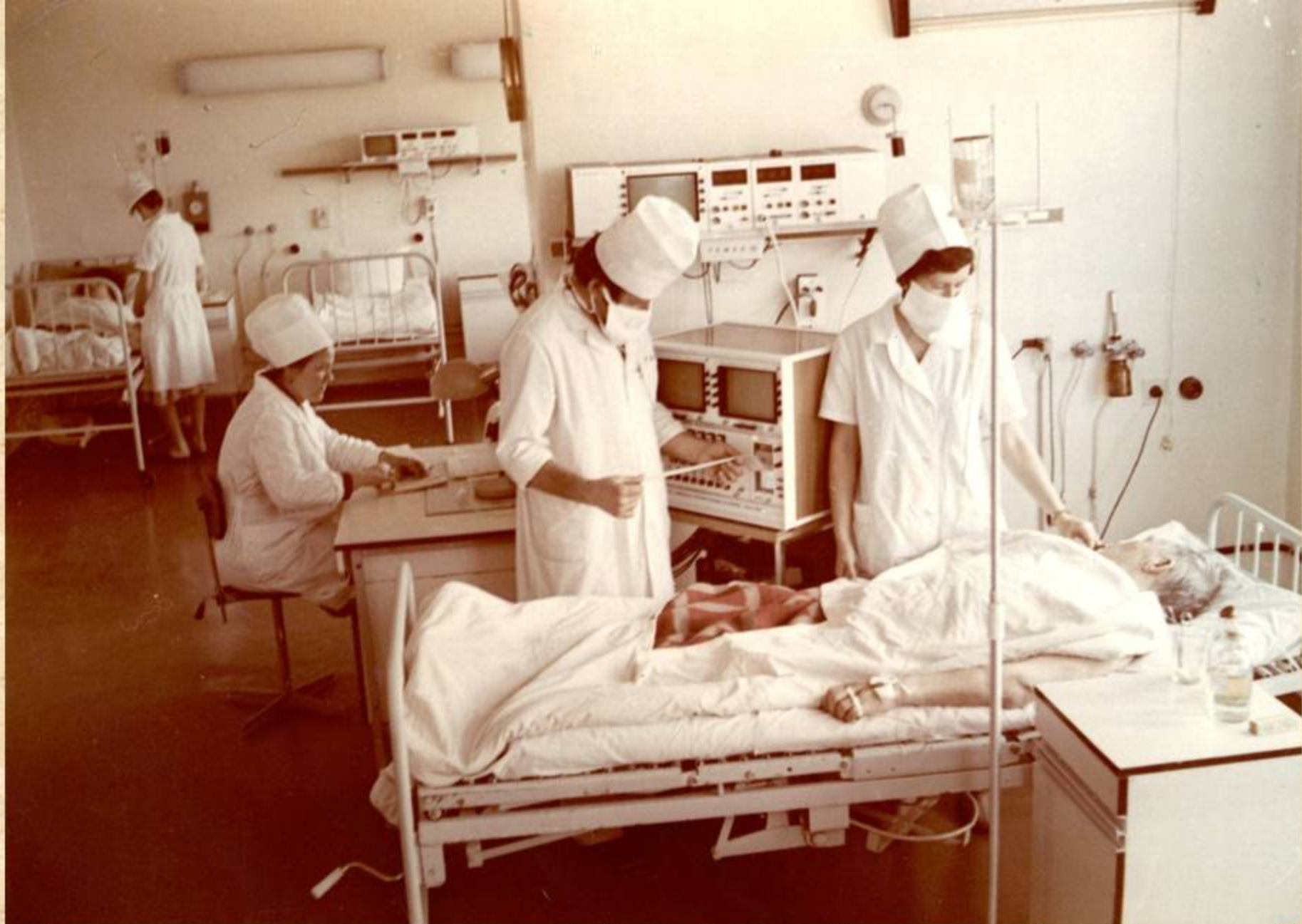
Реанимационное отделение Первой республиканской клинической больницы. 1980 г. ЦДНИ УР. Ф. 5034. Оп. 1. Д. 254.