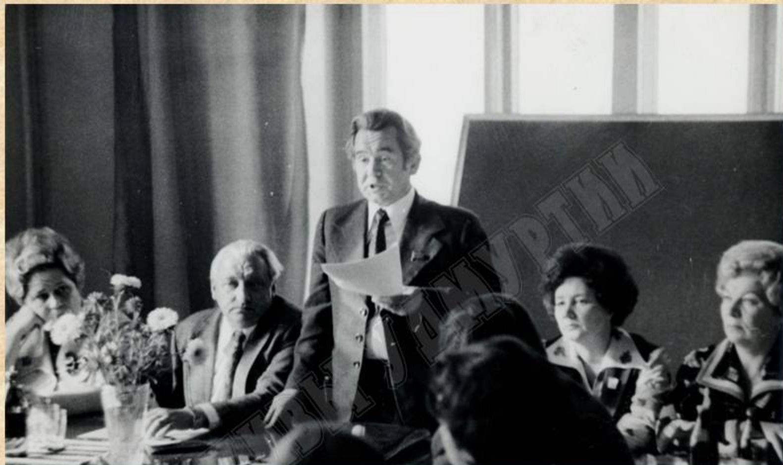
Министр здравоохранения УАССР В.Н. Савельев выступает перед активом медицинских работников Удмуртской республики. 1977 г.