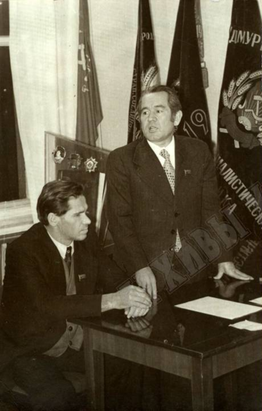
Министр здравоохранения УАССР В. Н. Савельев в Президиуме Верховного Совета УАССР произносит приветственное слово перед награжденными медицинскими работниками. 1976 г. ЦДНИ УР. Ф. 5034. Оп. 1. Д. 203.